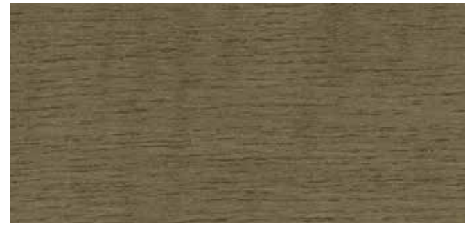
0637 NY STENGRÅ