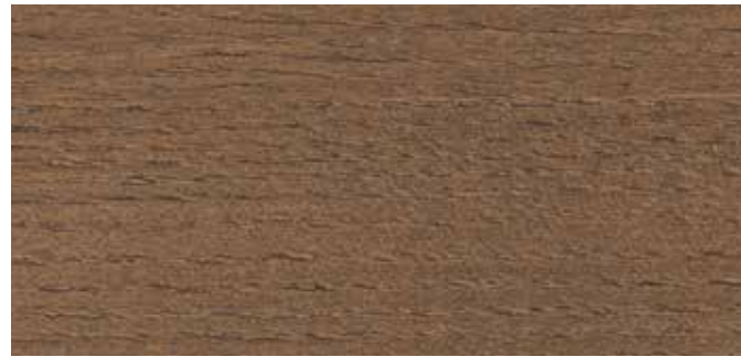
9052 EKSOTISK TRE