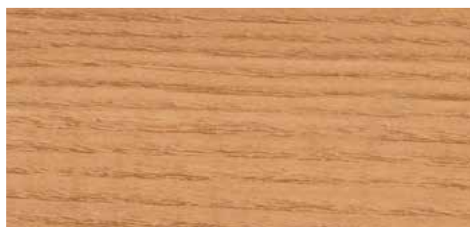
0935 SIBIRISCHE LÄRCHE