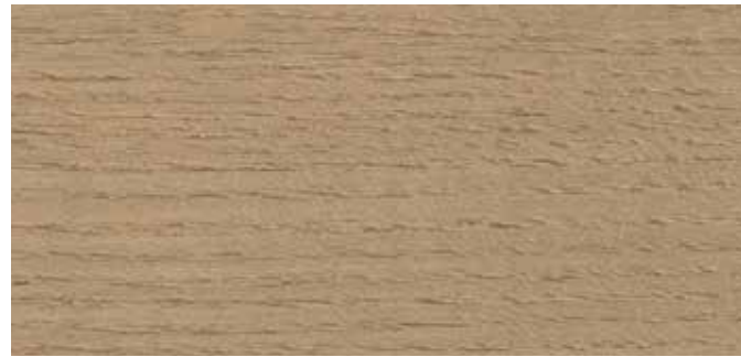
9074 NORDISK TRE