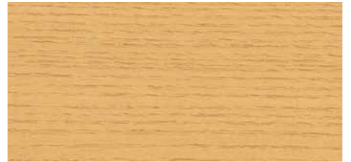
0631 NATURAL WOOD