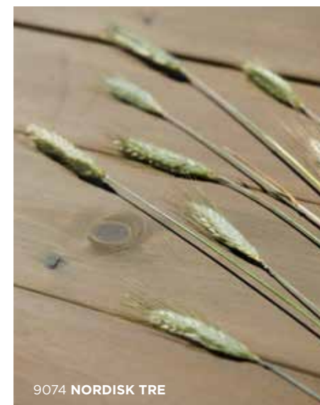
9074 NORDISK TRE