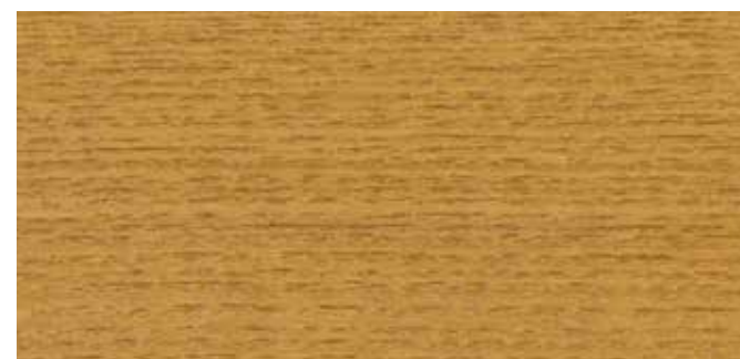
10083 EICHE ANTIK