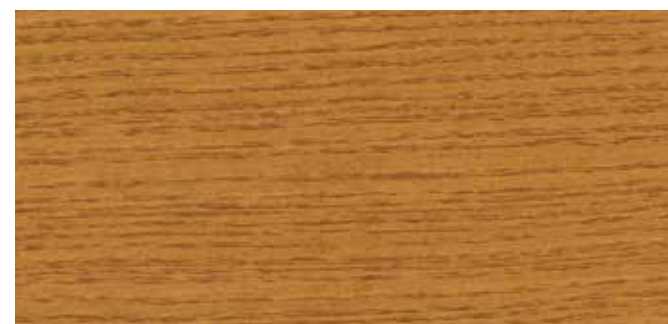
10009 EICHE DUNKEL